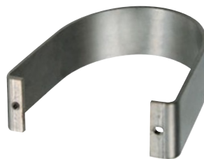
KIT STAFFE ACCESSORIE A CORREDO