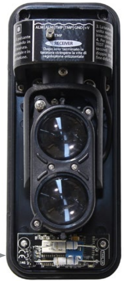
LEDS AD ALTA LUMINOSITA' BUZZER VISIBILE A 200m